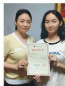
合家福施新菊女儿 考取安徽师范大学