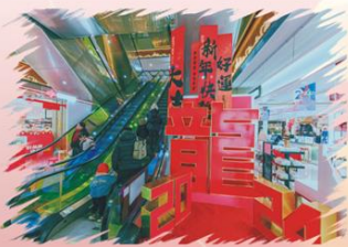
龙年吉祥 广德百大童朝辉