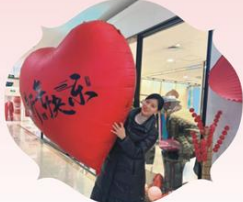
生意“心”“能” 巢湖百大耿丽