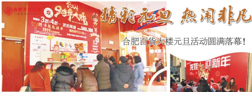
合肥百货大楼元旦活动圆满落幕!

四季更迭，时光流转，2024年的美好诗篇已经开始书写，1月1日合肥百货大楼开展了多彩的元旦活动。在这新年的第一个假期里，吸引了大批市民前来游玩打卡，活动期间百货大楼不仅陪伴大家在温暖的冬日里收获了多样的惊喜与快乐，也让合肥的节日氛围又“沸腾”了一把。