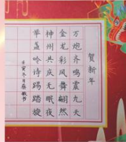
贺新年（硬笔）鼓楼金鹿蔡敬